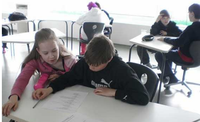
Mynd frá samvinnuþrófi í 6.-7. bekk