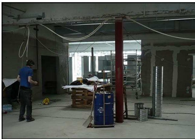
Mynd af heimasvæði 4.-5. bekkjar fyrir sléttu ári síðan !!

Það er sannarlega ótrúlegt til þess að hugsa að fyrir réttu ári síðan var Naustaskóli ekki til. Húsið var enn í byggingu og átti töluvert í land, hvað búnað varðar átti skólinn enn ekki svo mikið sem eina bréfastemmu! Búið var að ráða nokkra starfsmenn en þeir voru eiginlega bara andlit á heimasíðunni, stefna og starfshættir sömuleiðis bara nokkur orð á blaði, margir nemendur og foreldrar nokkuð óákveðnir um hvernig ætti að taka þessum nýja skóla og vísast sumir kvíðnir fyrir því hvernig til myndi takast. Á þessu ári hefur því mikið vatn runnið til sjávar, orðinn er til skóli með öllu sem honum fylgir, með ákveðnum brag og sérkennum. Þar hafa margir lagt sitt af mörkum og langar mig hér sérstaklega að þakka foreldrum fyrir þá jákvæðni og það traust sem þeir hafa sýnt við mótun þessa nýja skóla. Í könnun sem lögð var fyrir foreldra á dögnum kemur glöggt fram að foreldrar eru yfirhöfuð ánægðir með hvernig til hefur tekist og vænta greinilega mikils af skólanum okkar. Þar er hins vegar líka að finna skýrar vísbendingar um atriði sem þarfnast úrbóta og margar góðar athugasemdir og ábendingar sem við tökum til handargagns. Við erum auðvitað bara rétt að byrja og væntum þess öll að sameiginlega getum við búið til frábæran skóla, og það gerum við með því að hjálpast að og hlusta hvert á annað. Og til að taka af allan vafa er rétt að taka fram að lífið er svo sannarlega dásamlegt! Ágúst Jakobsson